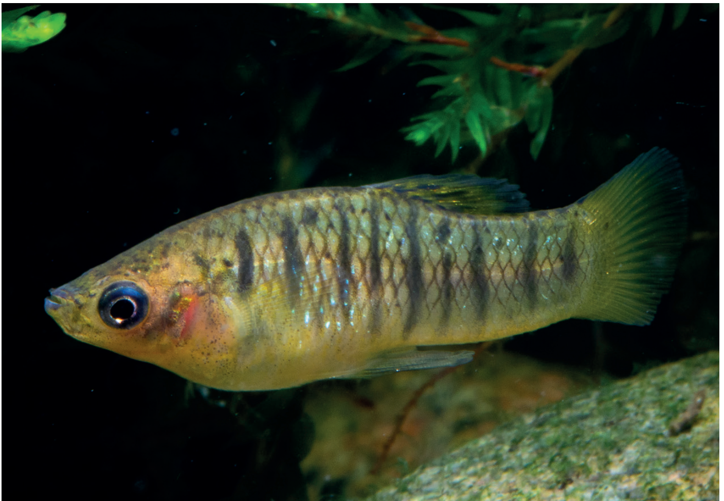
Die Männchen von Limia islai sind etwas farbenprächtiger als die Weibchen.