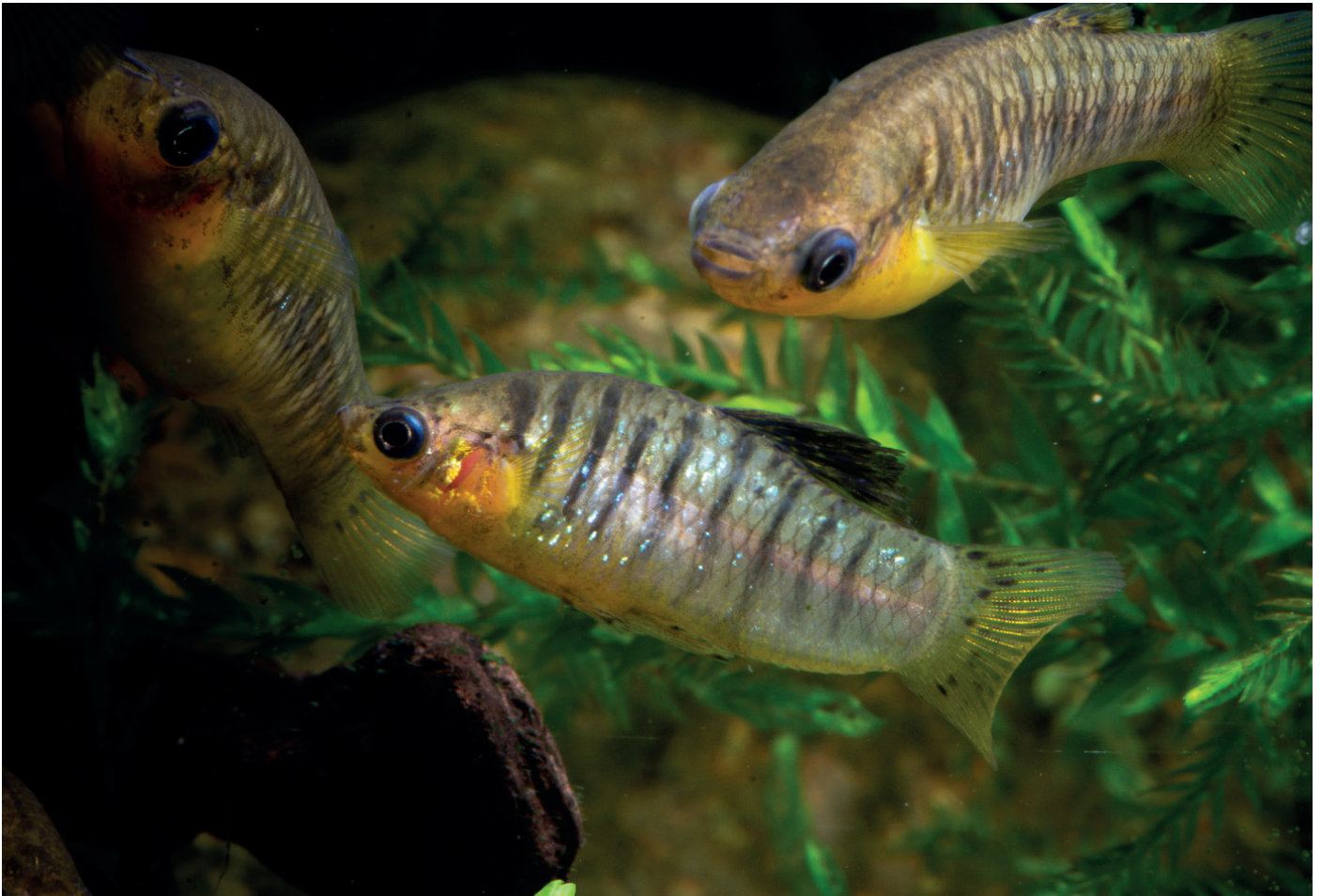
Tigerkärpflinge sind generell einfach zu haltende Fische. | Michael Jensen

Leider treten regelmäßig verschobene Geschlechterverhältnisse mit einem Überschuss männlicher Fische auf. Bei anderen Fischen sind viele verschiedene äußere Einwirkungen bekannt, die ursächlich sein können, wie z. B. Temperatur, pH-Wert, Salzgehalt oder Ernährung. Bislang konnte für den Tigerkärpfling noch keiner dieser Faktoren sicher bestätigt werden. In der Praxis reicht auch ein etwas geringerer Weibchenanteil aus, um einen Zuchtstamm zu erhalten und wachsen zu lassen. Tigerkärpflinge sind robust und fortpflanzungsfreudig. Auch der Einsteiger in die Aquaristik wird bei der Pflege im Artbecken schnell seine ersten Erfolge feiern dürfen.