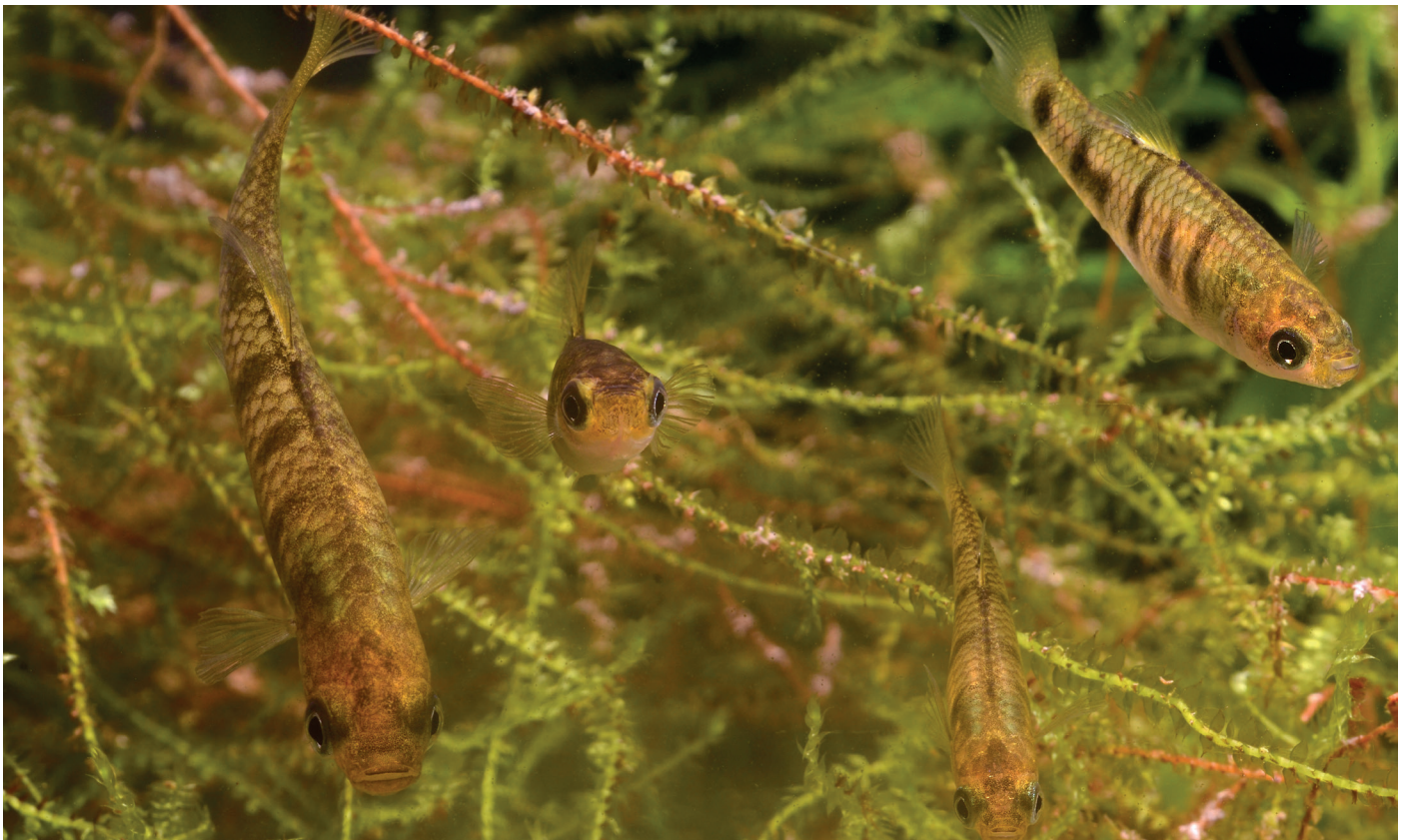
Tigerkärpflinge zwischen Aquariumpflanzen | Sebastian Wolf