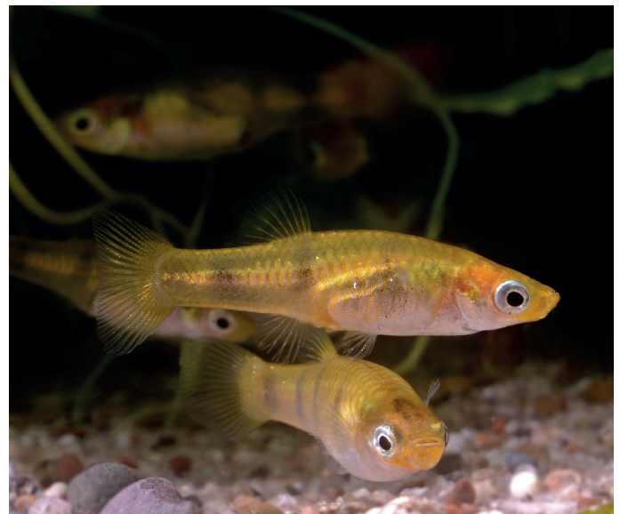
Weibliche Tigerkärpflinge sind lebendgebärend.

Bei guten Haltungsbedingungen bringen die Weibchen ohne weiteres Zutun des Pflegers in vierwöchigem Abstand Jungfische zur Welt. Tigerkärpflinge stellen ihrem Nachwuchs zumindest bei regelmäßiger Zugabe tierischer Kost und ausreichender Deckung nicht nach. Sie nehmen von Beginn an zerriebenes Flockenfutter (zusätzlich auch gerne Artemia -Nauplien) an, sodass der Halter keine weiteren Maßnahmen treffen muss.