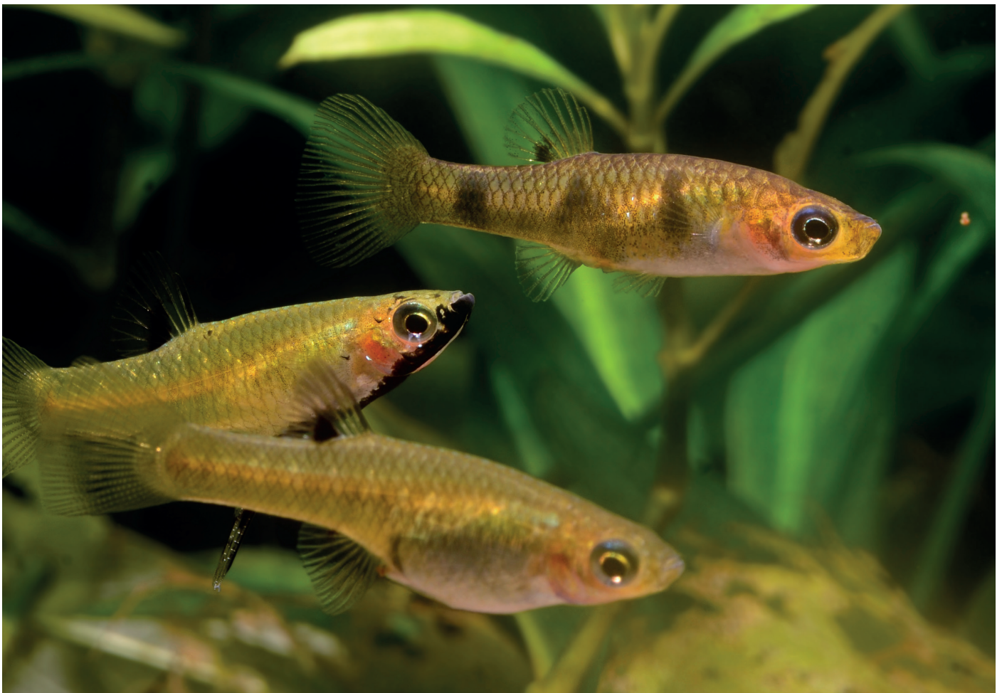
Zur Vergesellschaftung eignen sich zum Beispiel Metallkärpflinge ( Girardinus metallicus ). | Sebastian Wolf

So reizvoll ein Biotopeaquarium, in dem man Buckel- und Tigerkärpfling direkt vergleichen kann, klingen mag: Es ist keine gute Idee. Es besteht das Risiko, dass sich die beiden Arten kreuzen, was im Sinne eines Erhaltungszuchtprojekts auf keinen Fall passieren darf.