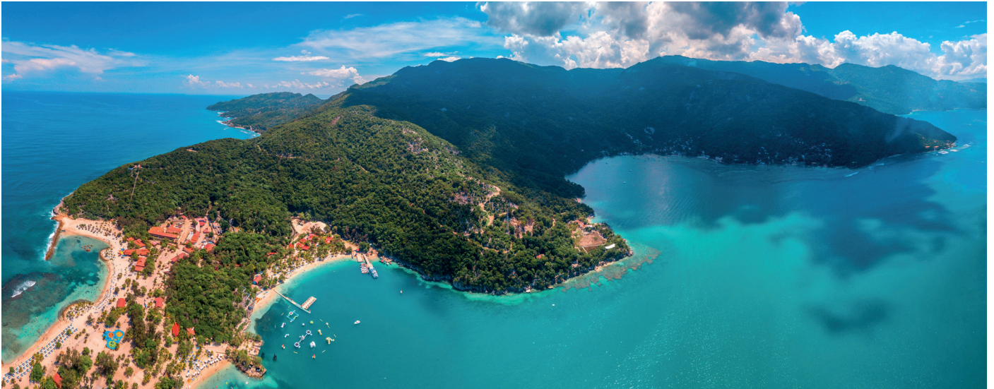
Limia islai lebt im Miragoane-See, dem größten Süßwassersee der Karibik, doch Lebensraumzerstörung und invasive Arten, machen dem Tigerkärpfling zu schaffen.

Der Tigerkärpfling ( Limia islai ) wurde erst 2020 beschrieben und gilt bereits als vom Aussterben bedroht. Die Art wird aufgrund des kleinen Verbreitungsgebietes und den in Folge genannten Gefährdungsursachen in der Roten Liste der IUCN als „Critically Endangered“ geführt.