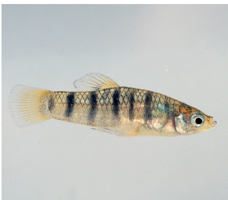
Männchen von Limia islai mit deutlich zu erkennendem Gonopodium | Manfred Schartl

Von seinem nahen Verwandten, dem Buckelkärpfling ( Limia nigrofasciata ), unterscheidet sich der Tigerkärpfling durch eine geringere Körpergröße. Die Männchen des Buckelkärpflings sind deutlich hochrückiger und weisen eine noch weiter ausgezogene Rückenflosse auf. Die Unterschiede in der Genitalmorphologie dürften dem Aquarianer nicht zugänglich sein. Bei jüngeren Exemplaren sind die Unterschiede äußerst gering.