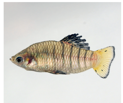
Zum Vergleich: Ein Männchen der Art Limia nigrofasciata | Manfred Schartl