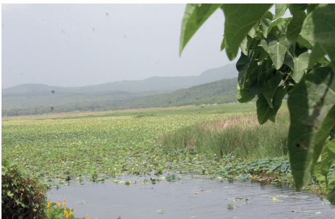
Blick auf den Miragoane-See in Haiti

Die große zoologische Besonderheit des Sees sind aber die Lebendgebärenden Zahnkarpfen aus der Gattung Limia . Wie die Buntbarsche des Tanganyika- oder des Malawi-Sees, die Darwinfinken von Galápagos oder die Lemuren auf Madagaskar haben sie den evolutionsbiologischen Prozess einer adaptiven Radiation durchlaufen, an deren Ende neun eigenständige Arten entstanden sind: Neben dem Tigerkärpfling und dem bereits erwähnten Buckelkärpfling zählen Limia fuscomaculata , L. garnieri , L. grossidens , L. immaculata , L. mandibularis , L. miragoanensis und L. ornata dazu (SPIKES et al. 2021).