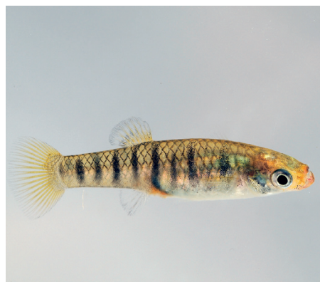
Weibchen von Limia islai sind weniger schmal und besitzen kein Gonopodium. | Manfred Schartl