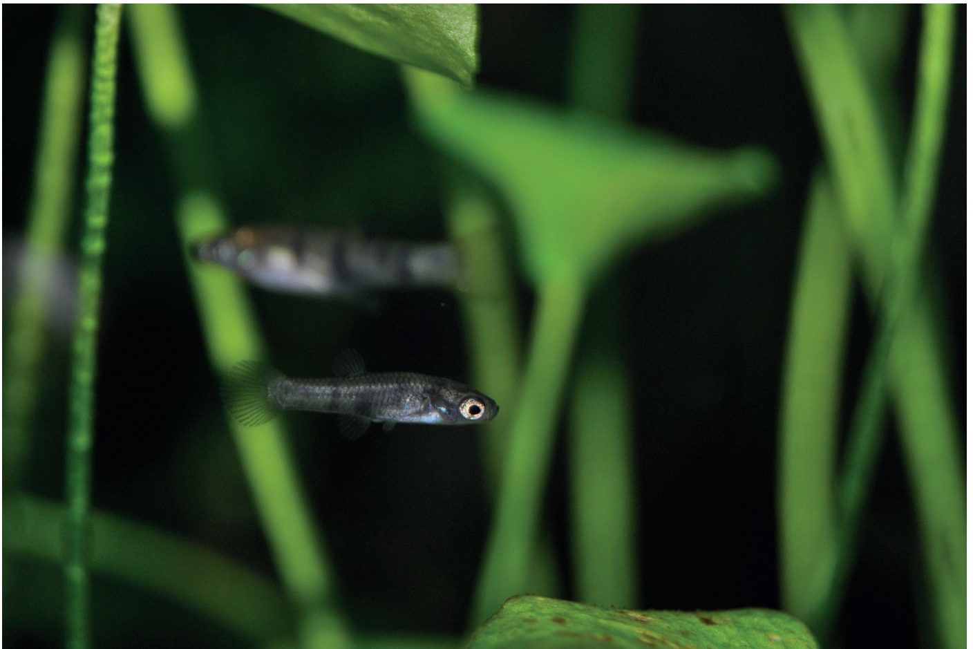
Limia islai wurde von der IUCN als „Vom Aussterben bedroht“ eingestuft.

Die afrikanischen Tilapien Oreochromis aureus und Coptodon rendalli sind seit Langem im Miragoane bekannt (LYONS & RODRIGUEZ-SILVA 2021), und auch Oreochromis mossambicus sowie der Asiatische Karpfen ( Cyprinus carpio ) wurden inzwischen dokumentiert (RODRIGUEZ-SILVA et al. 2021). Die langfristigen Auswirkungen dieser absichtlich ausgebrachten Speisefische sind kaum abschätzbar.